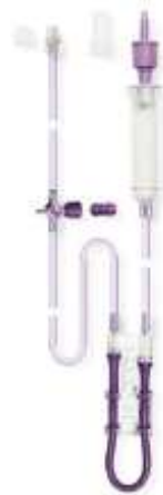
Flocare® Pack set Infinity™

for tilkobling af både Nutricias og andre leverandørers sondeernæring i pack. Tillader indgift af to slags sondeernæring eller sondeernæring og sterilt vand samtidigt.