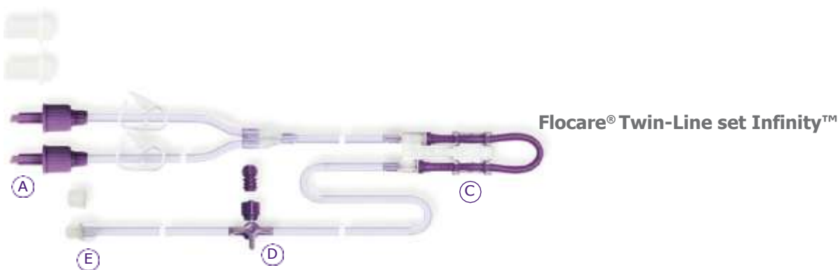
Flocare® Twin-Line set Infinity™