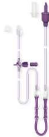
Flocare® Mobile Pack set Infinity™