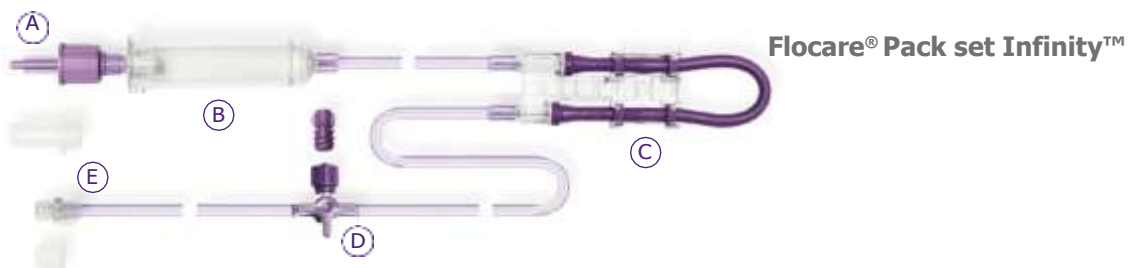
Flocare® Pack set Infinity™