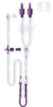
Flocare® Twin-Line set Infinity™