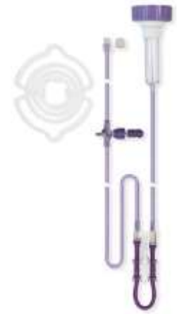
Flocare® Universal set Infinity™