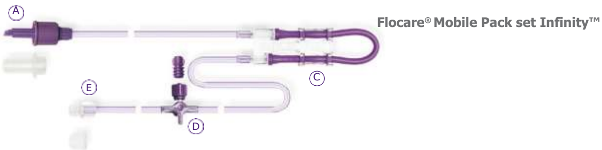
Flocare® Mobile Pack set Infinity™