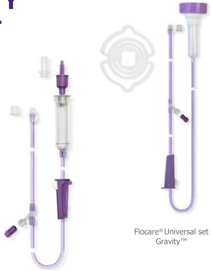
Flocare® Pack set Gravity™

for tilkobling af både Nutricias og andre leverandørers sondeernæring i plastic- og glasflaske.